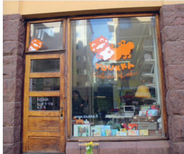
17.5. klo 12–16 Toukka Lastenkirjakeskuksella järjestetään runoklinikka, istutetaan runonsiemeniä ja Toukan kirjabussi esittäytyy.