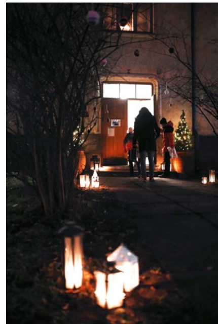
TI 22.11. Lyhtytyöpaja