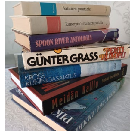
SU 27.11. Vaihdetaan ja viihdytään! - Kirjojen vaihtotapahtuma

kuvista syntyivät projektin avainkuvat teemoittain eteneviin kuvasarjoihin, jotka muodostavat nyt nähtävän meditatiivisen kuvaesityksen. Minne nämä kuvat sinut vievät, mitä mieleesi tuovat? Vapaa pääsy.