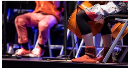
LA 26.11. Reilun soiton päivä

Tapahtuma on kaiken kokoisille ja ikäisille. Tapahtuman järjestävät alueen musiikkioppilaitokset Kallion musiikkikoulu, Keski-Helsingin musiikkiopisto ja Resonaarin musiikkiopisto. Vapaa pääsy. Tervetuloa!