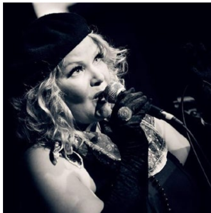
TO 24.11. Trio Gigi