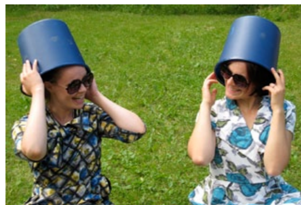
Villit ja vapaat –tanssiteatteriesitys 13.5.klo 12.30.