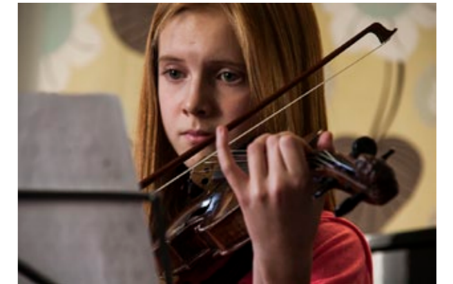
Avoimet ovet Kallion Musiikkikoulussa 14.5. klo 10-16.

19.00 PLANKO. Fyysinen teatteriesitys, joka käsittelee tiedostamatonta orjuutta ja itsenäisen ajattelun paradoksia. Ei suositella perheen pienimmille. Liput 3/6 €, lippuvaraukset plankovaraukset@gmail.com. HEO Kansanopisto, Kolmas linja 7 (sisäpiha).